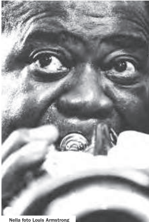
Nella foto Louis Armstrong

«La manifestazione è estremamente originale e valorizza insieme vocazioni artistiche, tradizioni enogastronomiche e bellezze naturali del territorio - dichiara l'assessore alle politiche culturali della Provincia di Roma, Cecilia D'Elia - Il progetto disegna un'area culturale e rafforza la sinergia tra i comuni del lago. La cultura in un momento di crisi come quello che stiamo attraversando è leva di sviluppo non solo civile ma anche economico e turistico». La formula è quella della crociera in musica e protagonista un gruppo di proposte di altissimo livello. Lo scenario quanto mai originale: il Lago di Bracciano che si trasforma in un grande palcoscenico per suoni e profumi. La Prima edizione della manifestazione prodotta dall'Associazione Culturale La Cittadella è sostenuta dall'Assessorato alle politiche culturali della Provincia di Roma, con il contributo della Regione Lazio - Assessorato Cultura Arte e Sport, in collaborazione con il Consorzio Lago di Bracciano, JazzUp Festival ed il patrocinio dei Comuni di Bracciano, Trevignano Romano e Anguillara Sabazia, del Parco Regionale Bracciano-Martignano e del Museo Storico di Vigna di Valle. Il programma delle serate: all'imbarco un cocktail di benvenuto accoglierà i crocieristi; a seguire la degustazione di vino curata dal marchio Slow Food che accompagnerà un menù tipico a base di pesce.