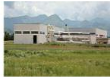
Impianto di Compostaggio