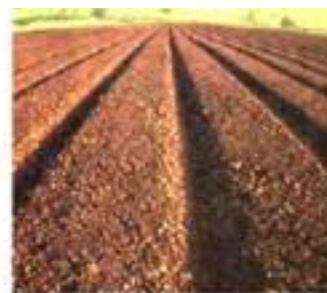
Utilizzo come fertilizzante naturale