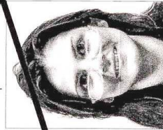
Montatura che taglia gli occhi