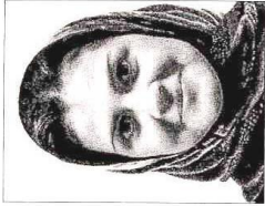
Foto con velo corretta