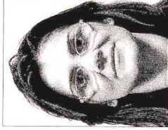
Foto con occhiali corretta