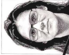
Montatura troppo pesante