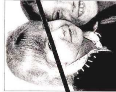
Seconda persona sullo sfondo