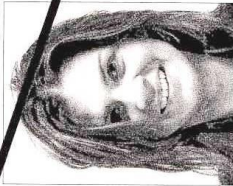
Capelli sugli occhi