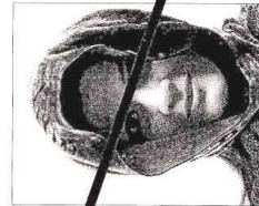
Ombra di velo sul viso