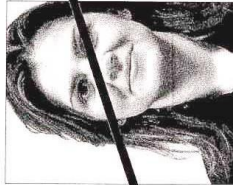
Posizione non corretta