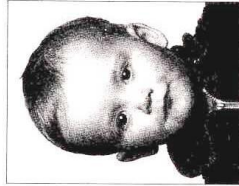
Foto bambino corretta