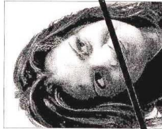
Occhi non orizzontali (viso inclinato)