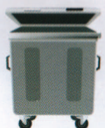
MATERIALI NON RICICLABILI